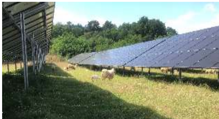
Abbildung 6: Extensive Schafbeweidung im Solarpark

Die Beweidung der Anlage mit Schafen stellt eine effektive und gleichzeitig naturnahe Pflegemöglichkeit dar, um z. B. eine Verschattung der Module zu vermeiden. Der Schäfer kann die eingezäunte Fläche nutzen und Einnahmen durch die Pflegeleistung erzielen. Die Schafe finden unter den Modulen Schutz vor der Witterung. Durch ihre Tritte schaffen sie bereichsweise offene Stellen, wodurch kleinräumige Strukturen entstehen, welche besonders von