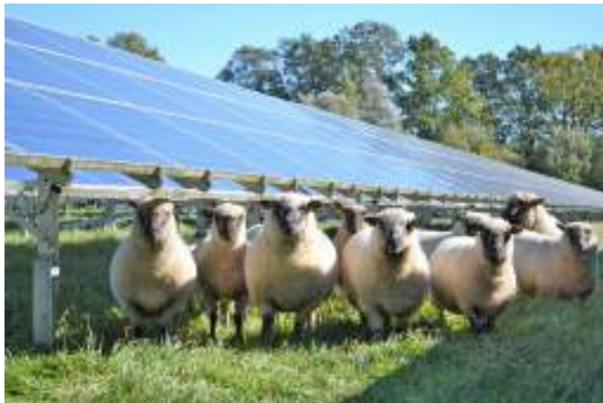
Abbildung 1: Schafbeweidung im Solarpark

Die Pflege der Solarparkflächen soll durch Schafbeweidung erfolgen. Der Vorhabenträger, der derzeit deutschlandweit ca. 400 Hektar Solarparkfläche beweidet lässt, entwickelt hierzu mit dem zuständigen Schäfer ein auf Naturschutz abgestimmtes Beweidungskonzept. Neben der Nutzung zur Energiegewinnung ist damit auch eine landwirtschaftliche Nutzung der Flächen möglich.