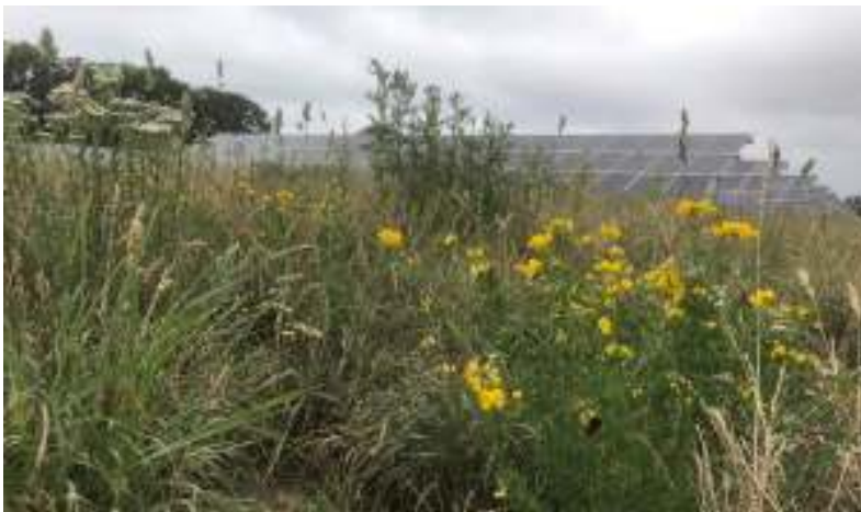
Abbildung 5: Artenvielfalt im Solarpark

Die Umsetzung des festgesetzten Planungskonzeptes wird sich erkennbar positiv auf Natur und Artenvielfalt auswirken. Durch die Extensivierung der Flächen und den Verzicht auf Pflanzenschutz- und Düngemittel kann sich der Boden langfristig von der intensiven landwirtschaftlichen Nutzung erholen und die Bodenfruchtbarkeit sowie die Wasserqualität gesteigert werden. Für viele Pflanzen- und Tierarten wird nachhaltig neuer Lebensraum geschaffen.