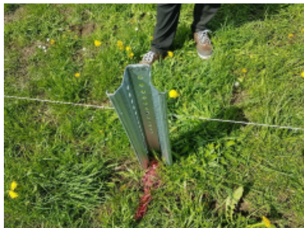
Abbildung 5: Rammfundament

Die Sondergebietsfläche wird mit Modulen überstellt. Durch Kabelgräben werden die einzelnen Modulreihen erschlossen. Stationsgebäude mit Nebenanlagen dienen der Transformation des elektrischen Stroms auf Mittelspannung. Die Querschnittsfläche eines Rammfundaments beträgt 0,0009 m 2 . Auf einer Fläche von einem Hektar werden ca. 530 Stück Rammfundamente eingesetzt. Dies entspricht einer Gesamtfläche von ca. 0,5 m 2 . Für Stationen werden pro Hektar Sondergebietsfläche ca. 5 m 2 in Anspruch genommen. Auf die Zaunpfosten entfallen ca. 2,5 m 2 pro Hektar. In Summe wird durch die Rammfundamente, die Stationen und die Zaunpfosten eine Gesamtfläche von ca. 8 m 2 pro Hektar versiegelt. Dies bedeutet, dass 99,92 % der Fläche nicht versiegelt wird. Durch die minimale Flächenversiegelung sowie einen Montageabstand zwischen den Modulen kann eine flächige Versickerung der Niederschläge gewährleistet werden.