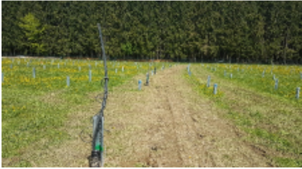
Abbildung 3: Verfüllter Kabelgraben