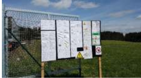
Abbildung 4: Baustellenordnung am Aushang

Für die Schutzgüter stellen Gefahrstoffe sowie der Einsatz von Baumaschinen eine potenzielle Herausforderung dar. Die notwendigen Vorkehrungen zur Vermeidung von negativen Einflüssen auf die Schutzgüter sind gesetzlich geregelt. Darüber hinaus wird den ausführenden Firmen eine Baustellenordnung, die unserem Büro zur Einsicht vorliegt, auferlegt. In dieser Baustellenordnung sind die wesentlichen Punkte, wie der Umgang mit Gefahrstoffen, die Einhaltung des Umweltschutzes, die Regelungen zum Baumaschineneinsatz (Einsatz von Kettenfahrzeugen zur Bodenschonung) und die separate Lagerung von Mutterboden, erläutert. Zudem werden die Vermeidungs- und Minimierungsmaßnahmen zur Bewahrung der Schutzgüter geregelt. Ein beschriebenes Ziel ist es die Planungsfläche bereits begrünt aus der landwirtschaftlichen Vornutzung zu übernehmen, was z. B. durch Einbringung von Untersaaten erreicht werden kann. Die Baustellenordnung wird als Anlage zum Durchführungsvertrag für das gegenständliche Vorhaben fest verankert.