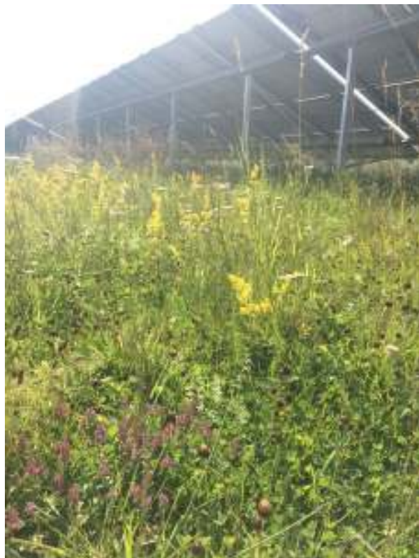
Abbildung 13: Artenreichere Bestandsfläche

Auf den zeichnerisch als Flächen für Maßnahmen zum Schutz, zur Pflege und zur Entwicklung von