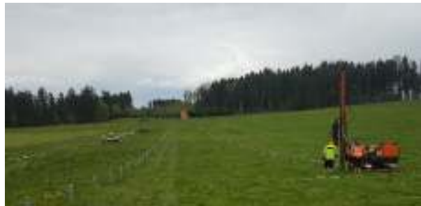
Abbildung 2: Hydraulikramme auf Ketten

Die Eingriffe in den Boden sind auf das Rammen der Fundamente, die Verlegung der Erdkabel sowie die Gründung für Gebäude, Wege und Zaunanlage beschränkt. Dafür wird die Fläche während der Bauphase befahren. Das natürliche Bodengefüge wird hier bereichsweise gestört und der Boden verdichtet. Aufgrund der sich stark verbesserten Effizienz der Baudurchführung ist jedoch von einer Beeinträchtigung geringen Umfangs auszugehen. Bei der hier gegenständlichen Planungsfläche wird von einer ca. 6-wöchigen Bauzeit ausgegangen. In dieser Zeit sind eine Hydraulikramme, zwei Radlader und ein Hydraulikbagger im Einsatz.