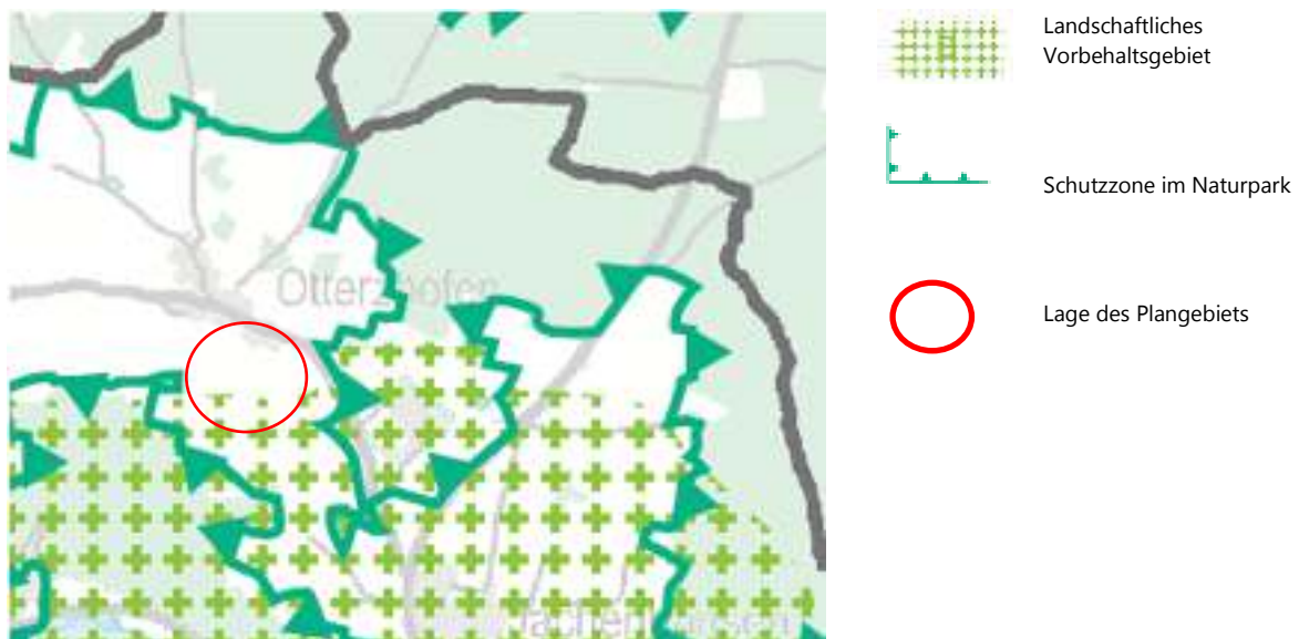
Abbildung 1: Ausschnitt aus Regionalplan Region Regensburg, Karte 3 Landschaft und Erholung

trägt dazu bei, Ressourcen und die Umwelt zu schonen und die Importabhängigkeit zu verringern.“