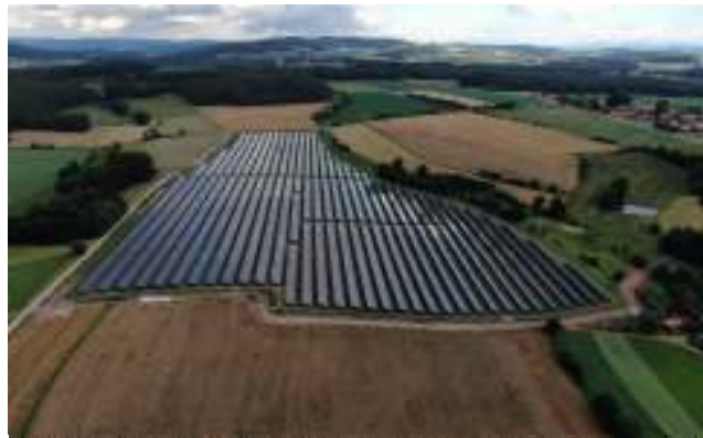
Abbildung 7: Gelungene Einbindung in die Landschaft

Das technische Element einer Photovoltaikanlage führt zu einer zusätzlichen Möblierung der freien Feldflur. Die Module, wie auch die Tragekonstruktionen, reflektieren einen Teil des einfallenden Sonnenlichts. Gegenüber vegetationsbedeckten Flächen erscheinen diese Objekte daher in der Regel als hellere Objekte in der Landschaft und können dadurch störend auf das Landschaftsbild wirken. Die Reflexion des einfallenden Lichts bedeutet einen Verlust an energetischer Ausbeute. Die Reflexion wird deshalb durch die Verwendung von Modulen mit Antireflexionsglas minimiert. Aufgrund der geringen Höhe der Module wird die Einsehbarkeit der Anlage verringert und damit auch die möglicherweise störenden Lichtreflexionen gering gehalten.