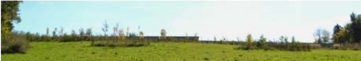
Abbildung 11: Eingrünung in Gruppen (nördlich des Solarparks)

Zur Eingrünung werden Gehölze in verschiedenen großen Trupps (zwischen 7 bis 25 Stück) in Gruppen von ca. 3 Stück je Art versetzt gepflanzt. Die Pflanzung erfolgt zwei- bis vierreihig mit einem Pflanzabstand von 1,5 m auf 1,5 m. Die genaue Artenzusammensetzung und die Qualität der Eingrünungspflanzung ist dem Plan und der festgesetzten Pflanzliste zu entnehmen. Zur Generierung von robusten Pflanzenbeständen und einer optimalen Eingliederung in das bestehende Ökosystem ist lediglich standortheimisches Pflanzgut zu verwenden. Die Pflanzung sollte im Winterhalbjahr durchgeführt werden. Optimale Anwuchschancen werden bei einer Spätherbstpflanzung erreicht. Bei frostempfindlichen Gehölzen empfiehlt sich eine Pflanzung im Frühjahr. Allgemein gilt: keine Pflanzung an Frosttagen.