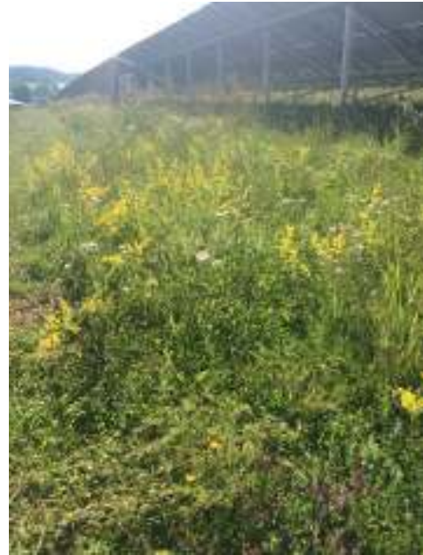
Abbildung 6: Artenreiche Vegetation

Durch die geplante Beweidung mit Schafen (s. Kapitel 10.2) sind durch das auf Naturschutz ausgelegte Beweidungskonzept positive Effekte auf die Artenvielfalt zu erwarten. Durch den unregelmäßigen Abfraß und Vertritt der Schafe entsteht ein Mosaik aus unterschiedlich hoher und dichter Vegetation bis hin zu komplett offenen Stellen und damit eine Struktur aus vielfältigen ökologischen Nischen für zahlreiche Lebewesen. Auch der Dung der Tiere bietet ein Habitat für darauf spezialisierte Insekten und Würmer und diese wiederum für insektenfressende Vogelarten eine zusätzliche Nahrungsquelle. Eine äußerst wichtige Rolle spielen Schafe darüber hinaus in ihrer Funktion als „Taxis“ bei der Biotopvernetzung. In ihrer Wolle bleiben Pflanzensamen, Insekten und sogar kleine Schnecken und Eidechsen hängen, die bei der Wanderung der Schafe von Biotop zu Biotop transportiert werden. So verbinden sie Gebiete, die ansonsten durch unüberwindbare Hindernisse wie Straßen getrennt wären. Viele seltene oder bedrohte Pflanzen sind auf den Samentransport durch Schafe angewiesen (RLP Agrosience GmbH (2020); Zahn; Tautenhahn (2016)).